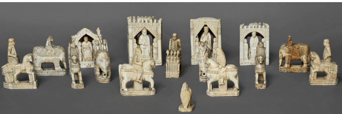
Figures d'échecs « de Charlemagne », ivoire, Italie du Sud, fin du XI e siècle. Proviennent de l'abbaye de Saint-Denis. Paris, Bibliothèque nationale de France, département des Monnaies, médailles et antiques

Ce livre raconte l'invention et la postérité des trésors d'églises, il explore la forme et la fonction de ces objets de mémoire qui furent source d'émerveillement pour les contemporains et qui le demeurent aujourd'hui, mais à un tout autre titre. Car ils nous fascinent désormais pour leurs qualités esthétiques et pour le sens que nous leur prêtons. Cet ouvrage, qui traite aussi de cette mutation, ouvre ainsi la voie à une véritable archéologie des pratiques historiques et muséales actuelles.