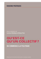
« Raisons pratiques » Traite une question vive de la théorie sociale et politique (analyse de l'action, du collectif).

Les Éditions de l'EHESS assurent l'édition de 5 revues de rayonnement international, qui contribuent à la circulation des débats et de l'actualité des sciences sociales : Archives de sciences sociales des religions , Cahiers d'études africaines , Cahiers du monde russe , Études rurales , Histoire & Mesure .