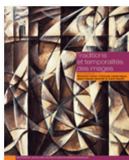
« L'histoire et ses représentations » Fondée par Louis Marin, elle est dédiée à l'histoire et à la théorie de l'art.