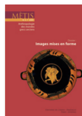
« Mètis. Anthropologie des mondes grecs anciens » Coéditée avec Daedalus, éditeur grec.

Deux collections, clairement identifiées, se consacrent à l'épistémologie des sciences sociales :