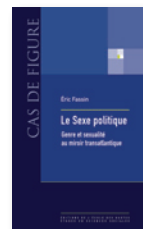
« Cas de Figure » Dans cette collection d'intervention, les auteurs offrent à leurs lecteurs des clés accessibles pour mieux comprendre le monde contemporain, sans s'affranchir des exigences scientifiques de leur discipline.