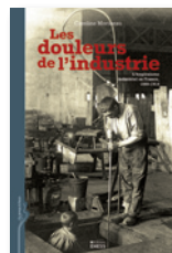
« En temps & lieux » Accueille les travaux de recherche fondamentale.