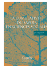
« Enquête » Privilège la confrontation entre les grandes disciplines des sciences humaines.

Deux collections, clairement identifiées, se consacrent à l'épistémologie des sciences sociales :