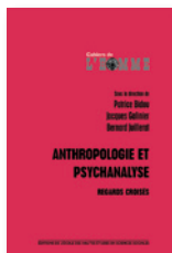
« Cahiers de L'homme » Dédiée à l'anthropologie.

Leurs parutions s'organisent autour de sept collections vivantes .